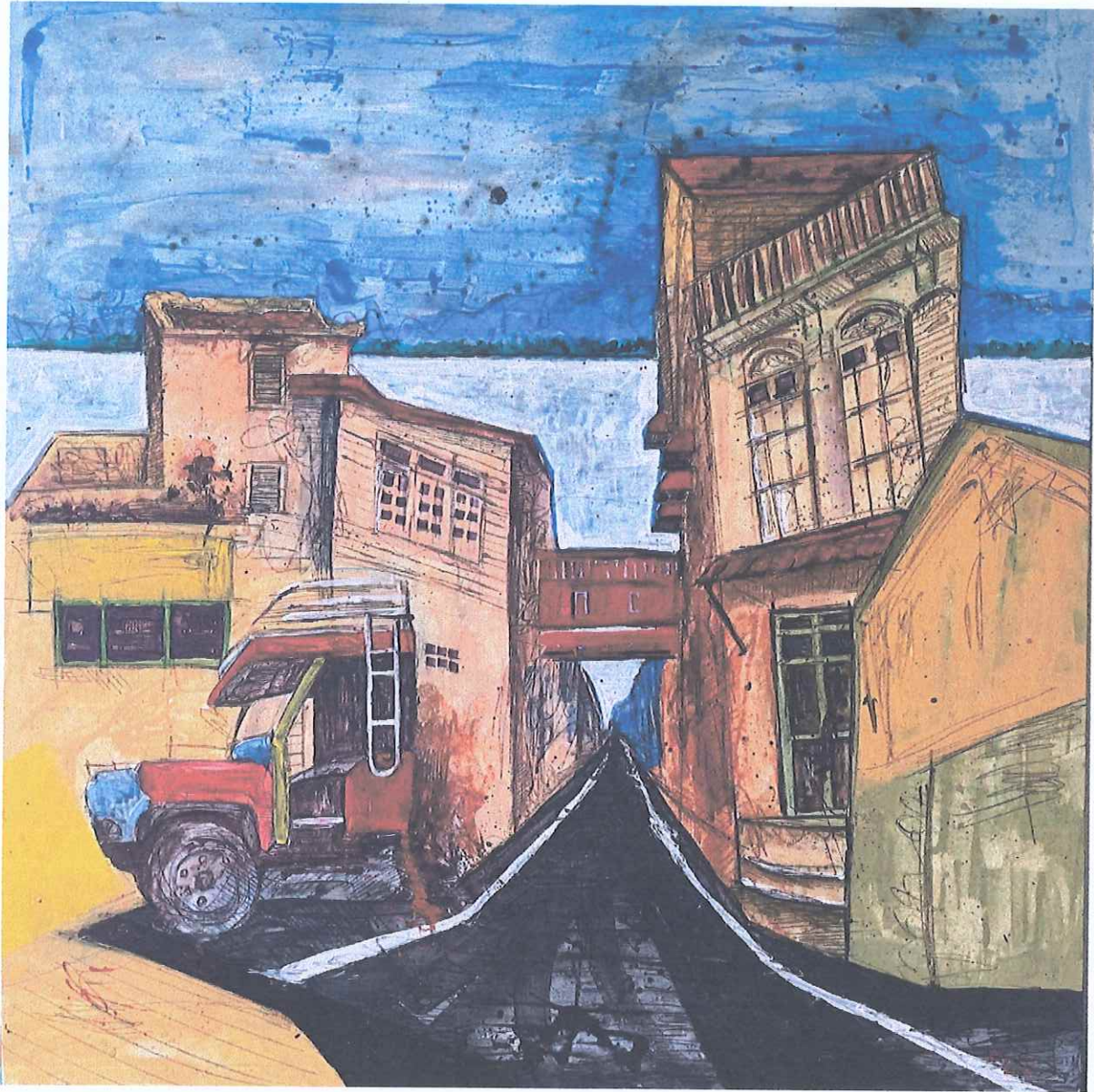
ชื่อผลงาน : Songkhla / Art Diary 01 ชื่อศิลปิน : นายพงศกร จงรักษ์ เทคนิค : เทคนิคผสมบนผ้าใบ ขนาด : 100 x 100 เซนติเมตร